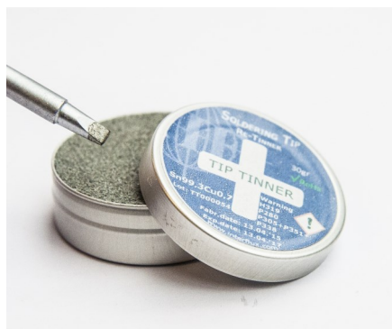
La photo n'est pas contractuelle

Les émissions de fumée, mêmes faibles, sont inhérentes au process. Comme pour toute opération de brasage manuel, une extraction d'air est conseillée.