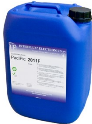
La photo n'est pas contractuelle

Le PacIFic 2011F permet de remplacer les flux à base d'alcool sans désavantages.