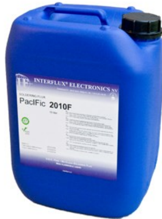
La photo n'est pas contractuelle

Le flux PacIFic 2010F est compatible avec les alliages sans plomb et SnPb.