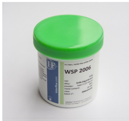
Abgebildetes Produkt kann vom gelieferten Produkt abweichen

Die Klassifizierung gemäß IPC und EN ist OR M0 .